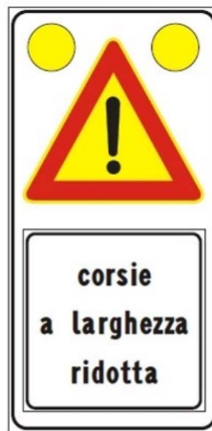
Figura II 391c Art. 31