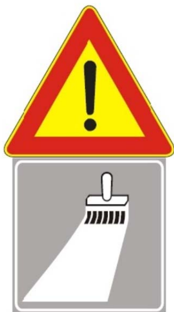
Figura II 391 Art. 31